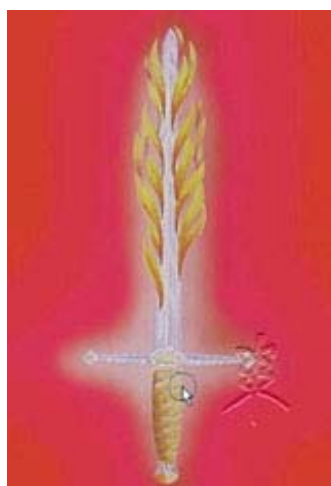
Rayo 1 Voluntad-Poder

Tipo de energía: sensibilizadora. Función: la inmortalidad de la persona.